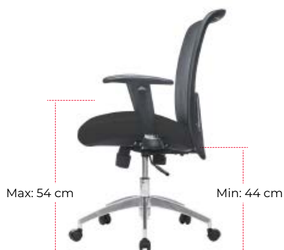
Altura máxima y mínima del asiento

Sistema up & down , el cual permite subir o bajar la altura de la silla a través de un pistón neumático, que le facilitará posicionarse en la altura deseada o de acuerdo a la estatura de cada usuario.